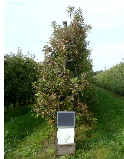
Concert pour pommiers